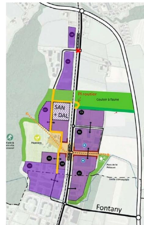
PAC Vernand – Vision directrice – principes d'aménagement à l'étude